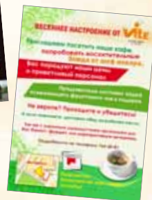
Листовки Флаера 115 г глянец